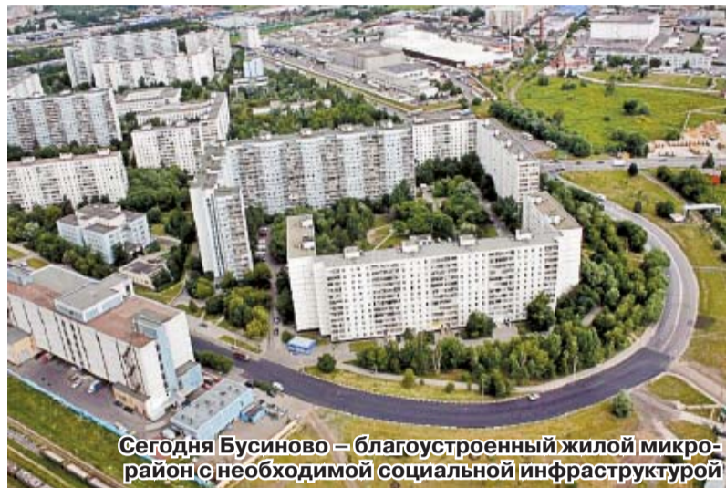
Сегодня Бусиново – благоустроенный жилой микрорайон с необходимой социальной инфраструктурой

отдала Бусиново Новодевичьему монастырю.