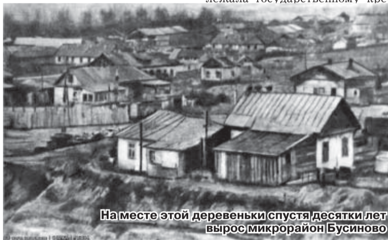
На месте этой деревеньки спустя десятки лет вырос микрорайон Бусиново

Сведения о деятельности И.А. Челяднина сохранились всего за несколько лет – с 1508 по 1514 год. Занимая высокое место среди московских бояр по своим заслугам и знатности, он носил еще и титул конюшего, дававшийся чрезвычайно редко (в XVI в. его имел лишь Борис Годунов), что свидетельствовало о полном доверии к нему со стороны великого князя Василия III. При нем он участвует в заключении мира с Литвой, окончательно присоединяет Псков, служит воеводой. Но во время смоленского похода 8 сентября 1514 г. терпит сокру-