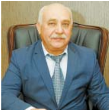
Дорогие жители района Западное Дегунино

Сердечно поздравляю вас с Днем народного единства! В этот день мы отдаем дань памяти и уважения истории нашей страны и населяющих ее народов. Главный исторический урок сегодня особенно актуален: государственное единство и общественное согласие – обязательные условия стабильного развития России, благополучия и безопасности ее граждан.