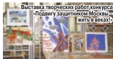
Выставка творческих работ конкурса «Подвигу защитников Москвы – жить в веках!»

были выставлены в клубе «Парус». Представлены 68 работ учащихся и 35 работ ветеранов войны и труда. Жанр работ разнообразен – графика и живопись, классные газеты и витражи, плакаты и сюжетные макеты. Победители конкурса награждены дипломами и грамотами.