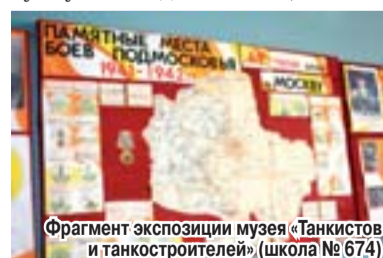
Фрагмент экспозиции музея «Танкистов и танкостроителей» (школа № 674)

В ноябре защитники Москвы получили памятные знаки, учрежденные по предложению Сергея Собянина в честь 70-летия начала контрнаступления советских войск под Москвой. Вместе со знаками ветераны получают красочный буклет, выход которого был приурочен к 70-летию Битвы за Москву. Буклет издан по инициативе и